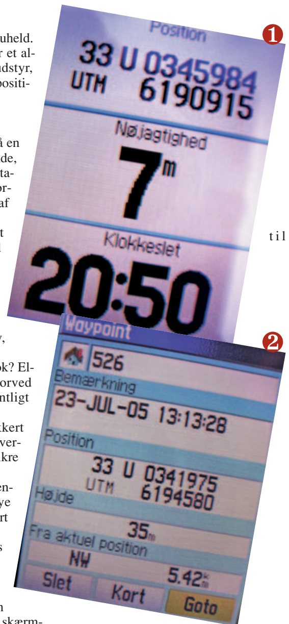
1 Figur 1. Visning af en positionsside. Displayet måler ca. 3,5 x 4,4 cm.

Det benyttede udstyr er Garmin eTrex Vista C. Det er valgt, fordi skærmstørrelsen er tilpas stor, og fordi skærmbilledet kan sættes op til at vise en positionsangivelse med større tal end normalt. GPS'en har et indbygget europakort, hvorpå en position kan vises, men kortet er ikke detaljeret nok til at blive brugt ved stedfæstelsen og kan heller ikke benyttes