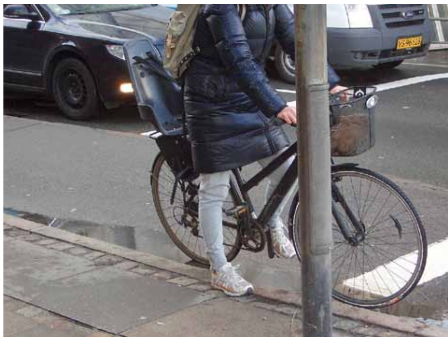
Figur 3. Trafikanterers placering ved stop for rødt ved krydsben med tilbagetrukne stopstreger.