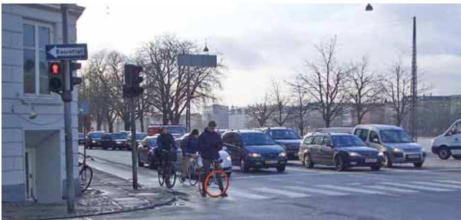
Figur 4. Eksempel på cyklist, der afventer grønt signal foran stopstregen.