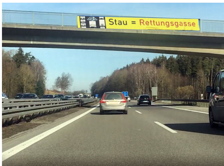
Figur 1. Eksempel på informationskampagne til trafikanterne på de tyske motorveje om etablering af redningsspor ("rettungsgasse") ved udrykning i tæt trafik/kø. Her fra A7 i februar 2019.

stopper op, nogle kører delvist ud i nødsporet, mens andre igen nærmest holder på tværs. Én dag passerer udrykningen midt på vejen mellem trafikanterne, en anden dag kommer beredskabet susende med blink og udrykning, men denne gang i nødsporet. I bund og grund er det ikke så mærkeligt, hvis vi som trafikanter kan være lidt usikre på, hvor vi kan forvente, at udrykningskøretøjerne passerer forbi os, og hvordan vi skal forholde os.