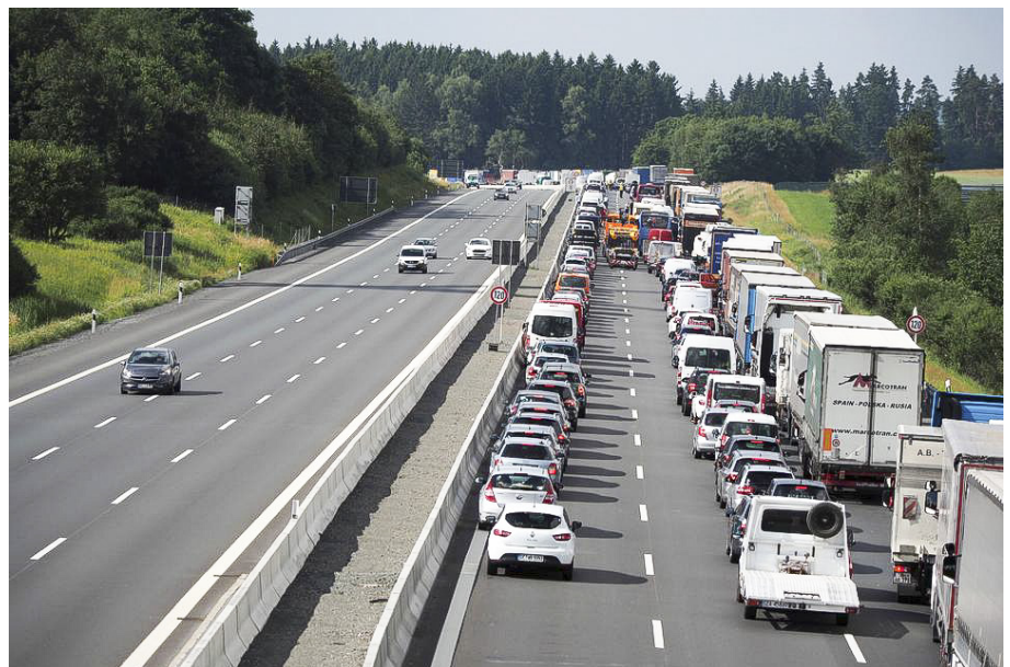
Figur 2. En typisk situation på tysk motorvej, her i nærheden af München: Kø efter et uheld. Bemærk, at trafikanterne holder "kontrolleret" på kørebanen og har dannet det særlige redningsspor, så udrykningskøretøjer kan komme frem.

Hvis der er plads, så kør frem og hold ind til siden, så bagvedkørende også kan trække ind. Hold i det hele taget helst stille, og hvis du foretager dig noget andet, så vær tydelig i det, du gør.