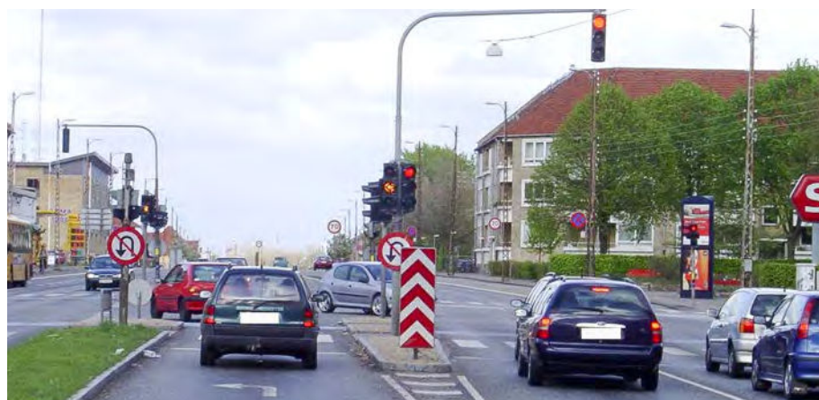
Figur 2. Eksempel på delehelle med kantstensbegrænsning mellem venstresvingsbane og spor til ligeudkørende.