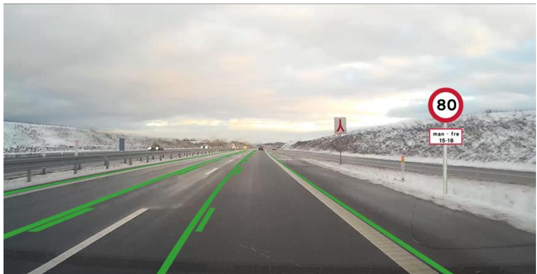
Figur 3.5 Midlertidig hastighedsbegrænsning vist sammen med grønne vognbanelinjer/spærrelinjer og hvide vognbanelinjer.

Til denne visning (se figur 3.5) er der stillet 3 spørgsmål.