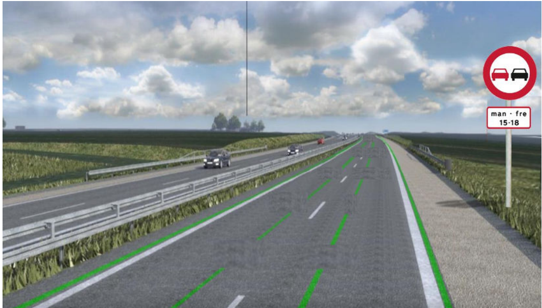
3.2. Tidsbegrænset overhalingsforbud sammen med grønne og hvide vognbanelinjer

Til denne visning (se figur 3.2) er der stillet 3 spørgsmål.