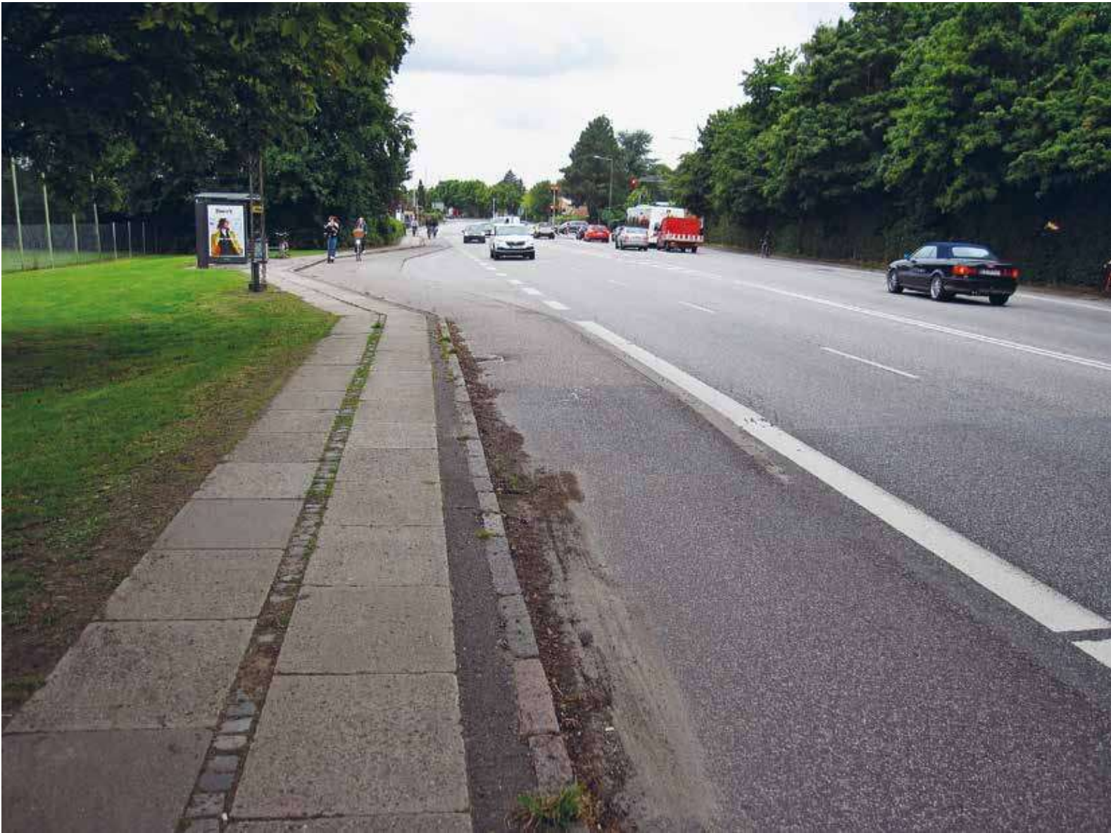
Figur 1: Foto af stop 346 Stenløsevej N i Odense, som er udformet som buslomme med busperron.

vej N i Odense, som er udformet som buslomme med busperron.), og her vurderes cyklisten altså at "tæbe" cirka 0,8 sekund som følge af den geometriske udformning.